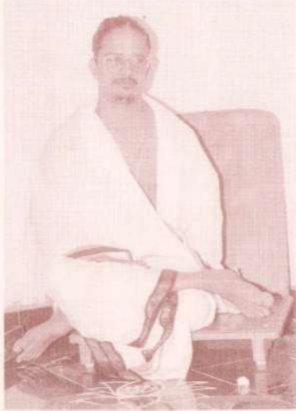
வைகுண்ட ஏகாதசீ அன்று சென்னை ப்ரேமிகபவளத்தில் ஸ்ரீ ஸ்வாமிகள்